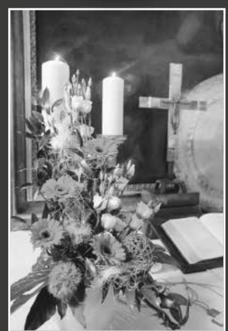
Altar St. Peter | Leutershausen

Diese Motive und viele weitere, aufgenommen von der Fotogruppe Blende 8, erhalten Sie an den bekannten Verkaufsstellen in Leutershausen: