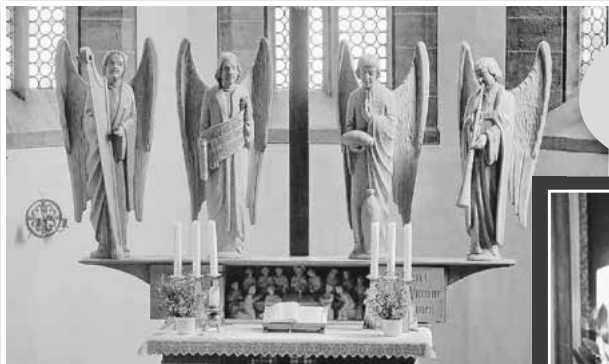
Altar St. Mauritius | Jochsberg