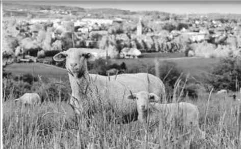
Höllbuck | Leutershausen