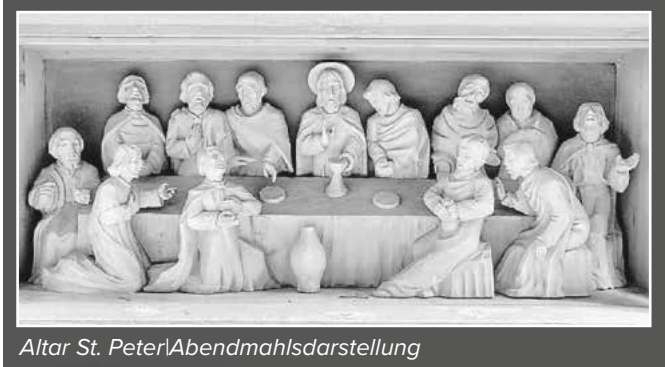
Altar St. Peter | Abendmahlsdarstellung

Die Aufnahmen von Stefan Diezinger haben mit ihren Motiven alle auch einen Bezug zur Gemeinde Leutershausen: