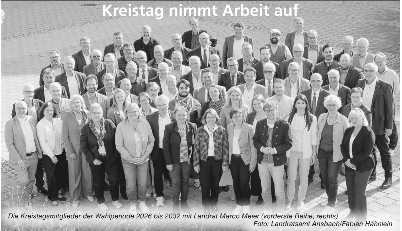
Die Kreistagsmitglieder der Wahlperiode 2026 bis 2032 mit Landrat Marco Meier (vorderste Reihe, rechts)