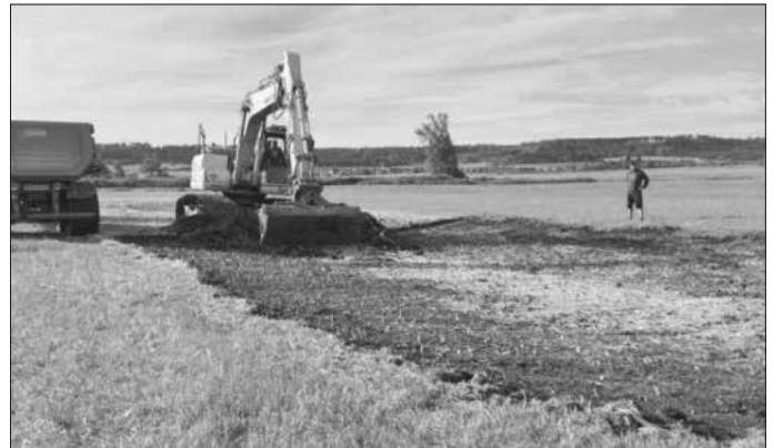
Erneuern einer „verschliffen“ Mulde bei Eckartsweiler durch das Projekt

Unter www.lebensraum-altmuehltal.de finden Sie weitere Informationen.